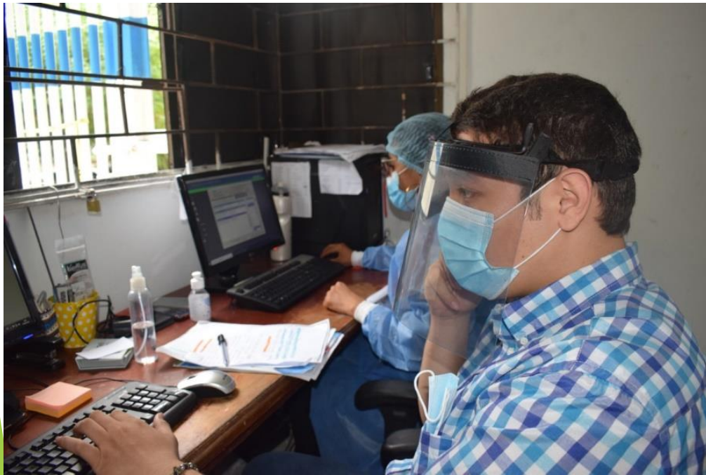
Área de Admisiones